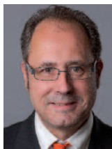
Christophe de PONTON d'AMECOURT