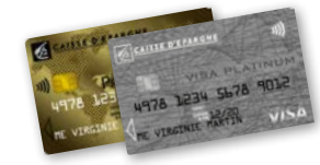
Jusqu'à 125 € par nuit