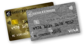
125 € / nuit – Max 3 nuits (après 10 jours d'hospitalisation)