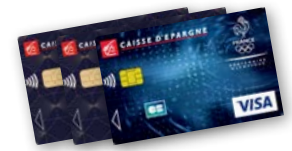
Jusqu'à 65 € par nuit