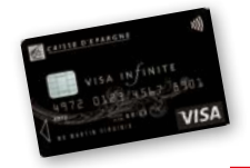
Jusqu'à 200 € par nuit