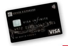
200 € / nuit – Max 375 € (après 7 jours d'hospitalisation)